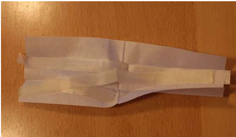
Bamushaut als „Schlauchstreifen“

Hier zeige ich, wie ich es mit Bambushaut mache. Here I show you how I make it with bamboo skin